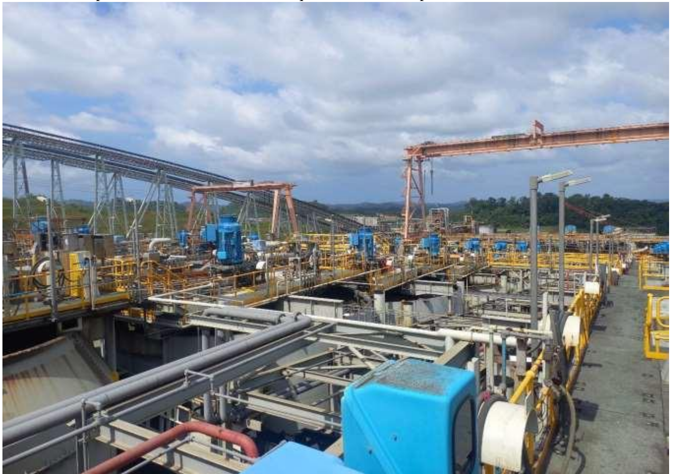
Imagen de la zona en donde se realizaban los procesos de separación de los metales y manejo de este. Lo que se observa es el tercer piso de esta estructura

En cuanto a la planta de molibdeno, indicaron que la misma no se pudo construir.