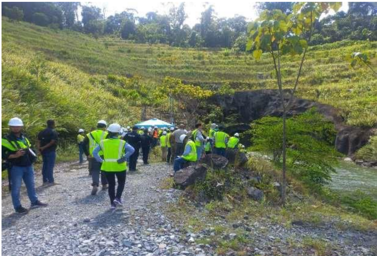
Imagen del túnel de decantación en donde realizan monitoreos de la calidad de agua

La gran cantidad de material en estas 2000 Hectáreas necesitan mantenerse húmedas para evitar que el material se vuelva particulado pueda difundirse en los poblados cercanos y ocasionar silicosis.