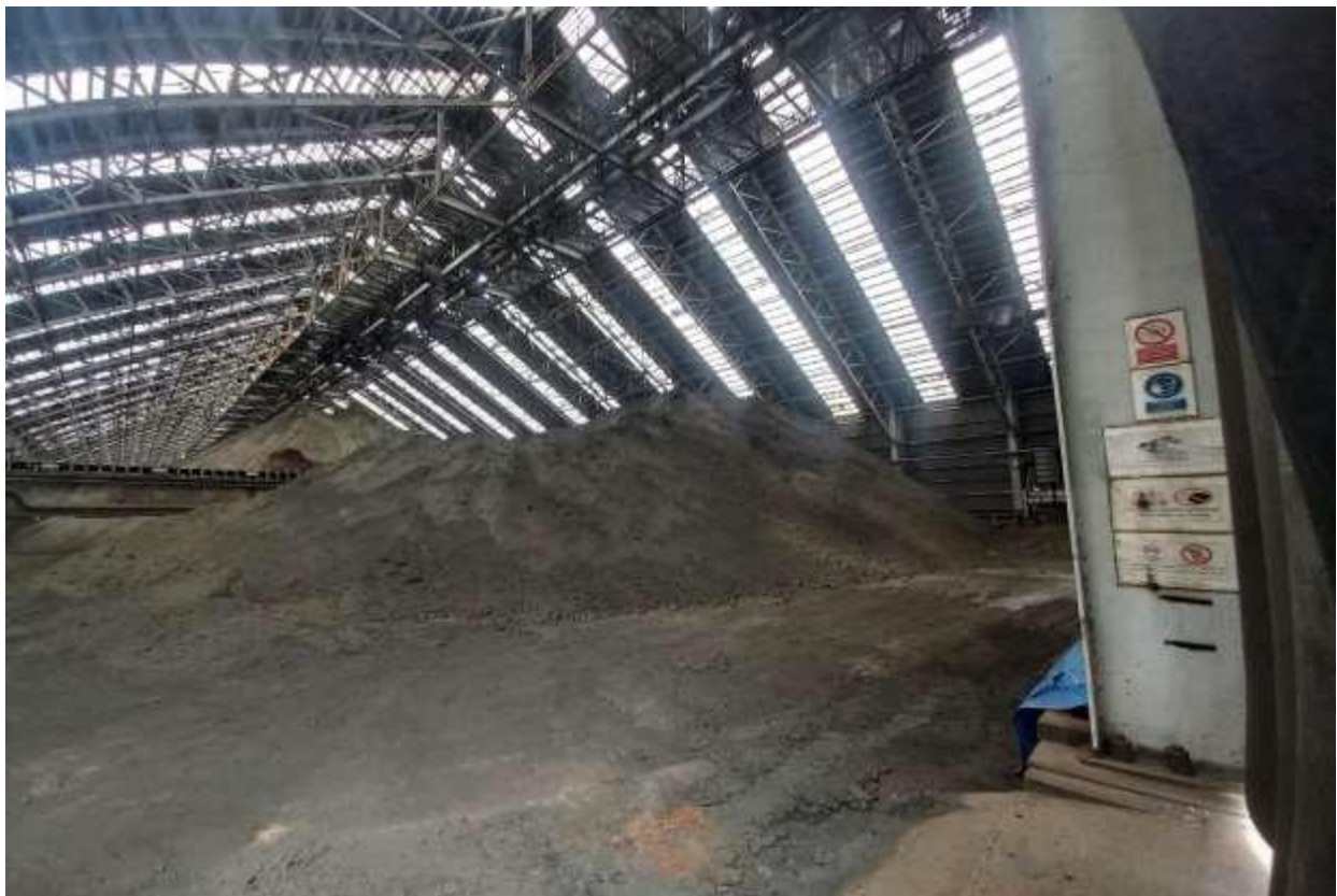
Imagen del material ya tratado y que contiene entre un 25 o 26% de cobre, además del resto de azufre y hierro. El volumen de este material sería unas 132 mil toneladas de material para ser exportado. La cantidad aproximada de eso sería unos 250 millones de dólares. Sin embargo, por el almacenaje que tiene, actualmente se está calentando hasta unos 70° centígrados. Además de mostrar evidencia de la generación de sulfuros de hidrógeno y sulfuro de carbono. Estos gases son corrosivos y con la capacidad de generar ácidos. Además de que son fáciles de inhalar, por lo que son un riesgo a las personas próximas. Todo lo cual implica darle un manejo y salida a este material potencialmente tóxico. Sin embargo, es necesario que el mismo sea realizado en todo momento de acuerdo a lo que