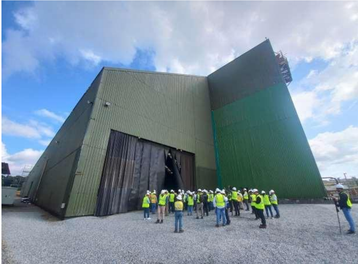
Imagen de la galera de concentrado. Dentro de la misma se deposita el material molido y tratado para su manejo