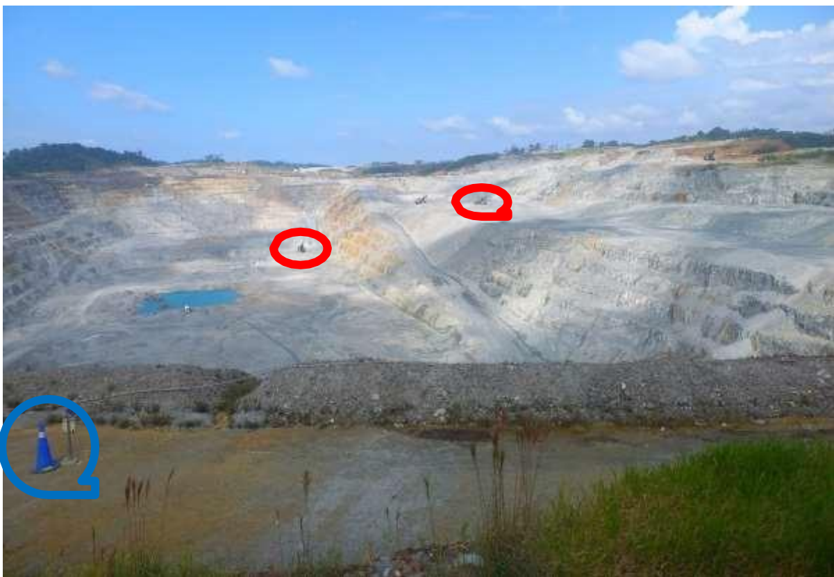
Imagen frontal del tajo. Lo que se ven como puntos son palas de extracción cuya altura es de 4 a 5 pisos, marcadas en rojo. Marcado en azul, equipo de meteorología

El primer Punto por recorrer fue el Mirador Este, del Tajo Botija