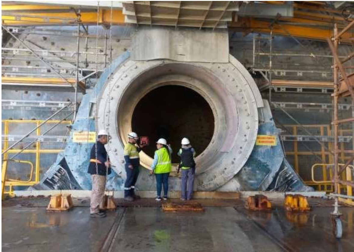
Este es uno de los molinos que se encuentran detenidos

Otro punto visto fue la zona de “molienda” de roca